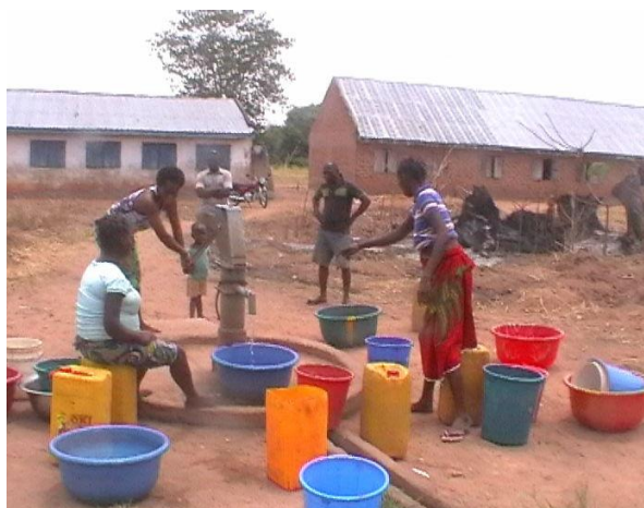
et puits dans la cours de récréation

Pour continuer à financer toutes ces actions, nous avons la grande chance de pouvoir compter sur l'attribution régulière de subventions communales. Nous tenons à remercier chaleureusement les autorités communales qui nous soutiennent depuis de nombreuses années. En 2013 : Bardonnex, Cologny, Lancy, Collonge-Bellerive, Chêne-Bourg, Puplinge, Thônex, Chêne-Bougeries, Pregny-Chambésy et Veyrier pour un montant total de CHF 40'400.-.